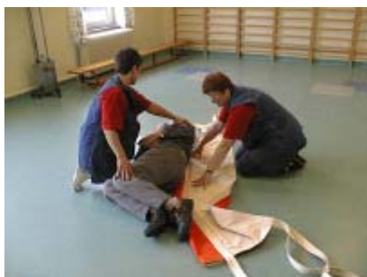
3. Borgeren ruller om på siden. Glidelagnet skubbes ind under borgeren.