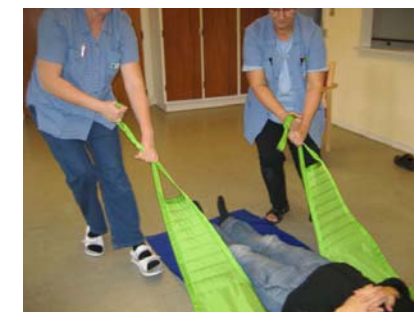
2. Herefter er det enkelt med træk i sejlets benstropper at flytte borger i borgers længderetning.