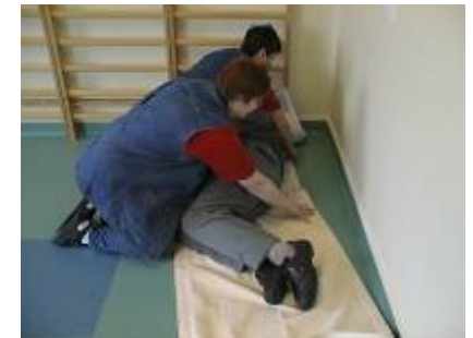
4. Glidelagnet glattes ud.