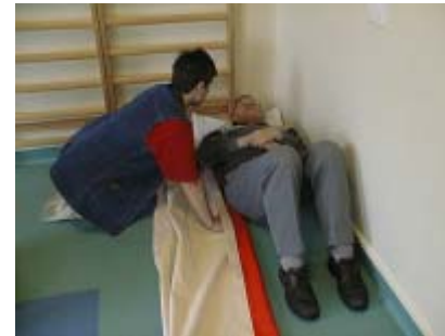
1. Glidelagnet foldes ca.10 cm.

Eksempel 2: Forflytning af borger på gulvet, hvor hjælperne kun kan komme til fra én side