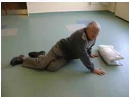
3. – rejser overkroppen op.