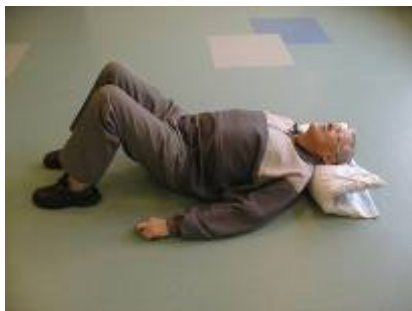
1. Borgeren bøjer knæene op.

Du skal guide borger op verbalt ud fra følgende billedserie, som gengiver det naturlige bevægemønster.