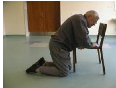
5. Hjelperen placerer en stol foran borgeren. Borgeren kommer op på knæ ved at støtte sig til stolen.