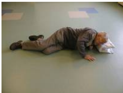
2. – ruller om på siden og støder fra med hænder og albue.