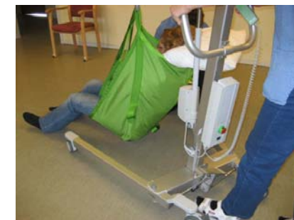
6. Borgeren liftes op.