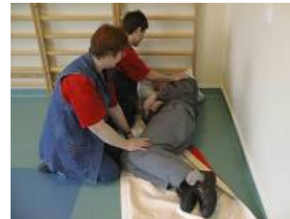
3. Borgeren ruller om på siden.