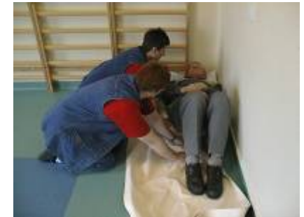
2. Glidelagnet skubbes 5-10 cm ind under borgeren. Borgerens fødder placeres på glidelagnet.