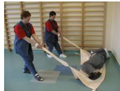
5. Borgeren kan trækkes sidevejs.