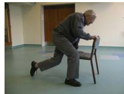
7. – støtter sig til stolen og rejser sig op eller sætter sig direkte på stolen.

Vær opmærksom på følgende, som vil have indflydelse på borgers mulighed for selv at komme op: