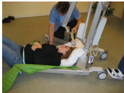
4. Liftens ben køres omkring borgers krop, til borgers hoved er helt tæt oppe af liften. Liften BREMSES!

Eksempel 2: Forflytning af borger på gulvet, hvor hjælperne kun kan komme til fra én side