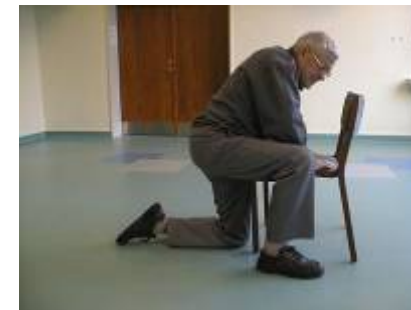
6. – bøjer det ene ben op ved siden af stolen, så stolen kommer tæt på kroppen.