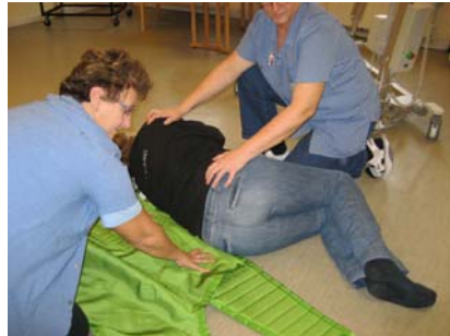
2. Sejlet lægges, så kanten følger borgers ryg, En tredjedel af sejlet foldes over og skubbes godt ind under borger.