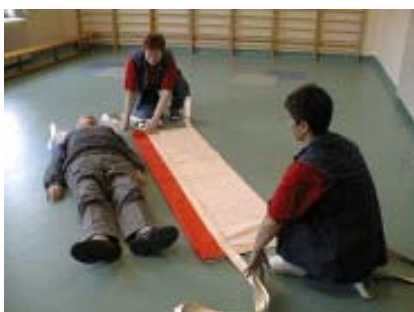
1. Fold glidelagnet på langs til midten.

Eksempel 1: Forflytning af borger på gulvet, hvor hjælperne kan komme til fra begge sider af borgeren.