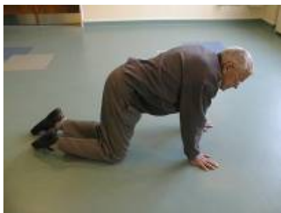
4. – løfter enden, så han står på alle fire.