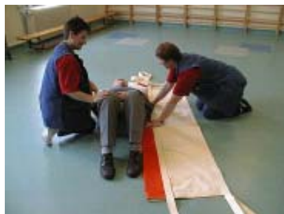
2. Borgeren ligger med bøjede knæ.