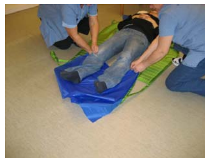
1. Spielerduk lægges dobbelt under borgers hoved og under fødderne. (tag skoene af, så er det nemmest).

Er der behov for at flytte borger lidt for at skabe nok plads til at bruge liften, og har I glemt glidelagen, kan sejlet sammen med spielerduk placeret under borgers hovedpude og ben bruges lige så effektivt.