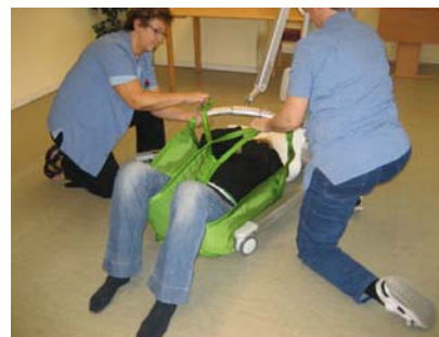
5. Sejlets stropper sættes på - først ved hovedet, dernæst ved benene. Kryds benstropperne.

Se endvidere billede 5 og 6 i eksempel 2: