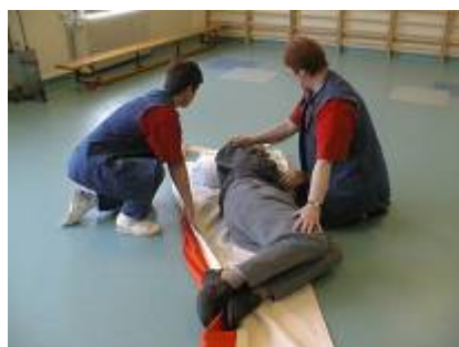
4. Borgeren ruller om på den anden side. Glidelagnet glattes ud, hvorefter borgeren ruller om på ryggen

Se endvidere billede 5 og 6 i eksempel 2: