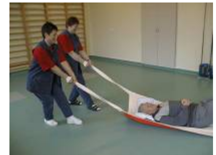
6. – eller i borgerens længderetning.