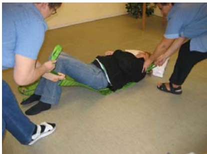
3. Borgeren ruller om på ryggen. Der trækkes blidt i sejlets stropper til sejlet ligger glat